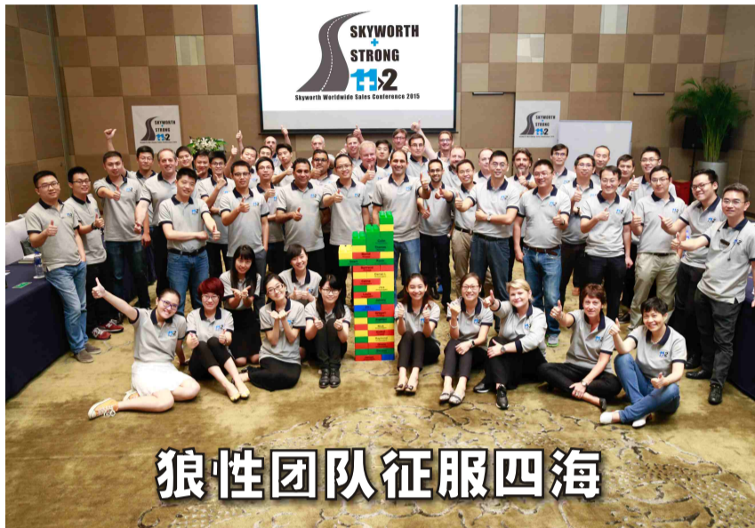
狼性团队征服四海

在这个机会爆炸的多元化经济时代，竞争无处不在。国内外机顶盒市场群雄征战，硝烟四起，有这么一群人，他们漂洋过海、背井离乡，低调工作着，面对海外机顶盒市场的血腥厮杀，传承着企业的狼性团队协作精神，先于对手嗅到猎物的踪迹，优于对手锲而不舍地狩猎，精于对手准确无误地分工合作，快于对手分毫不差地获取猎物，在业界人人都要敬他们三分。